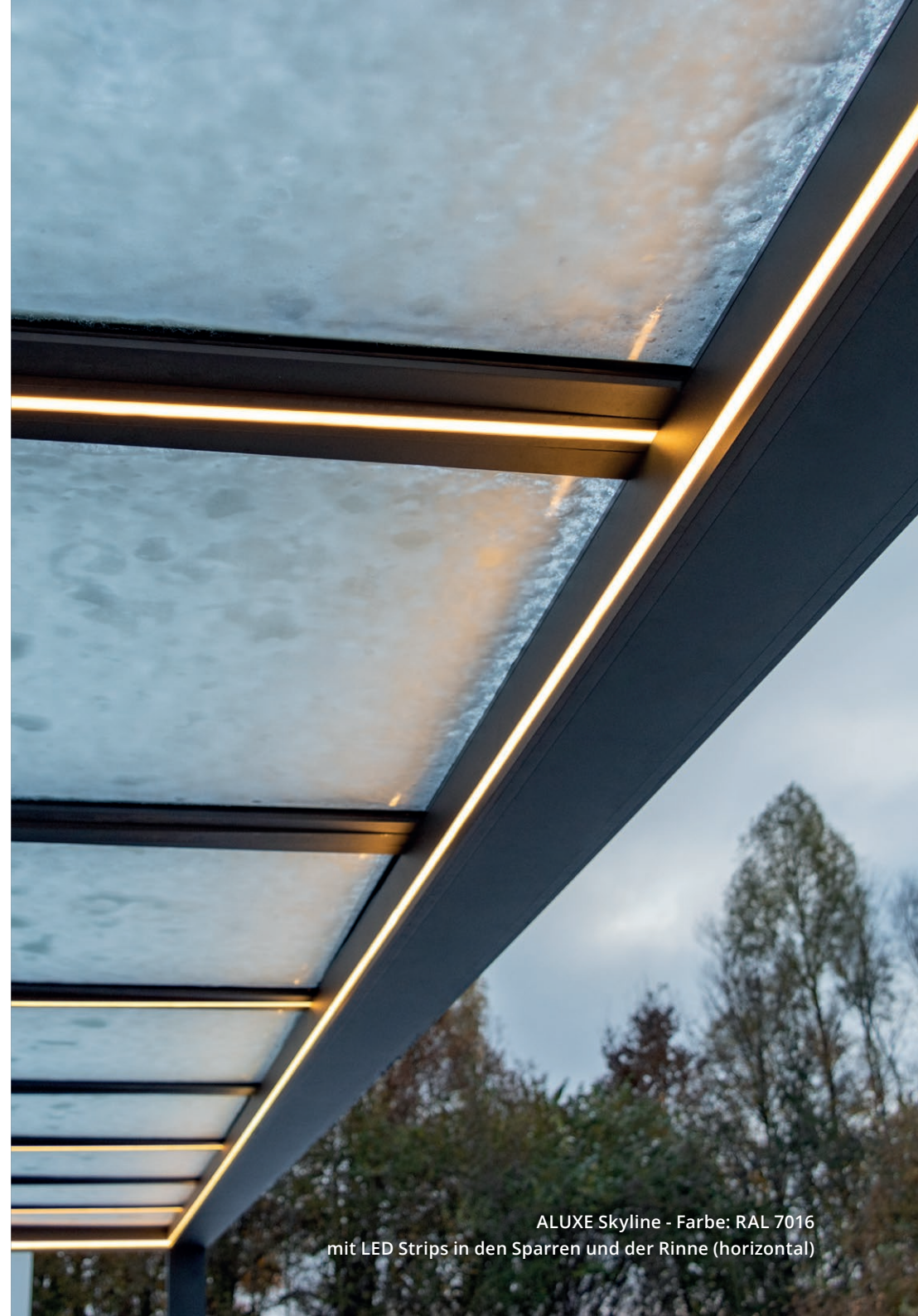
ALUXE Skyline - Farbe: RAL 7016 mit LED Strips in den Sparren und der Rinne (horizontal)