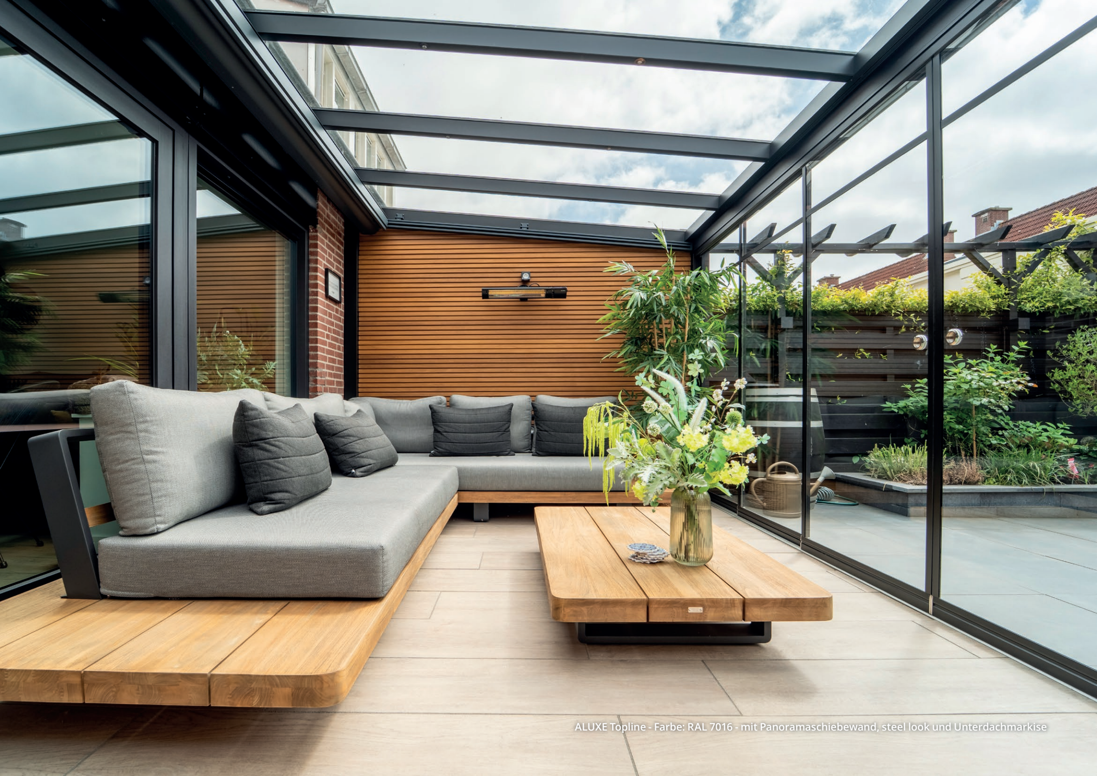
ALUXE Topline - Farbe: RAL 7016 - mit Panoramasciebewand, steel look und Unterdachmarkise