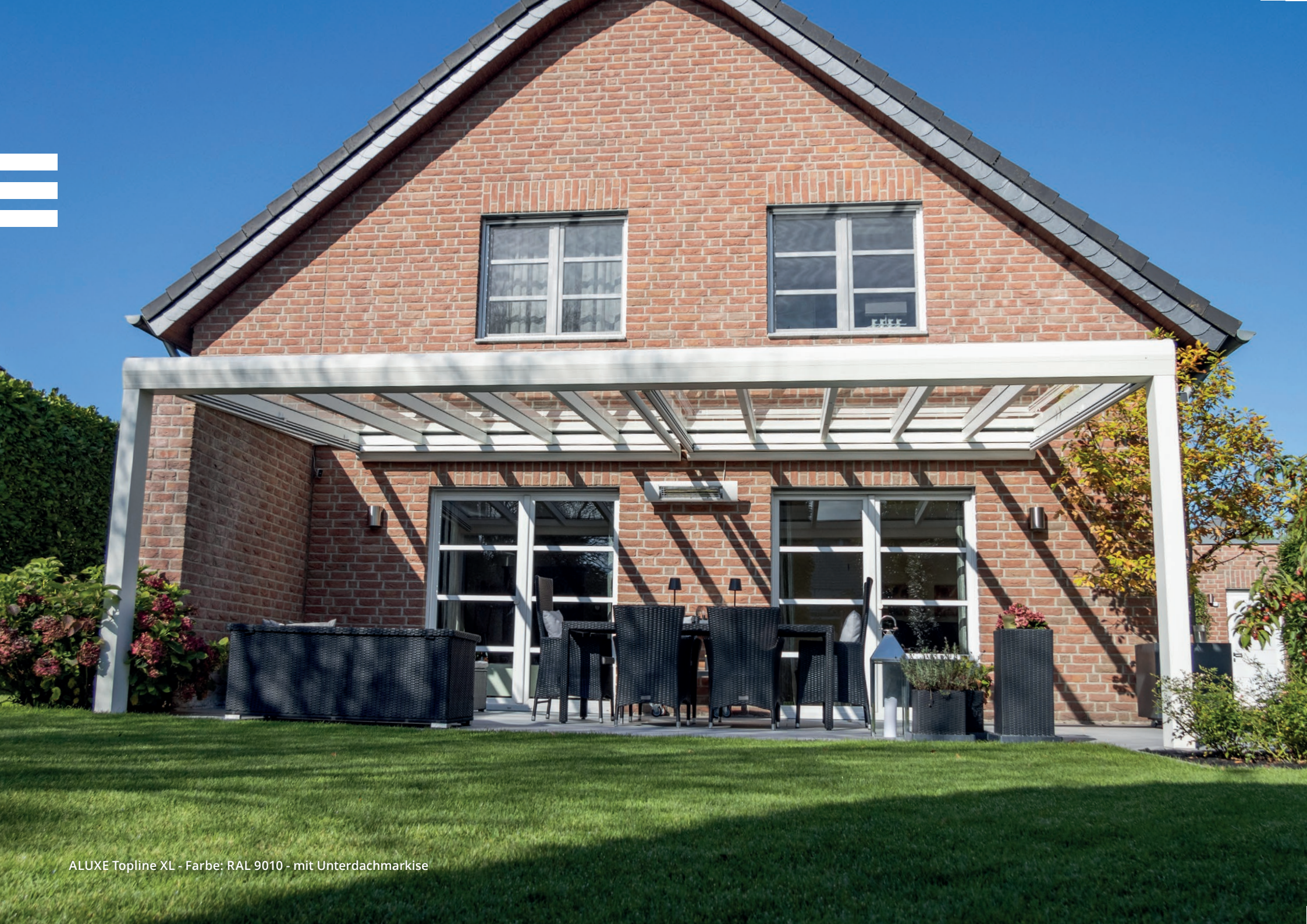
ALUXE Topline XL - Farbe: RAL 9010 - mit Unterdachmarkise