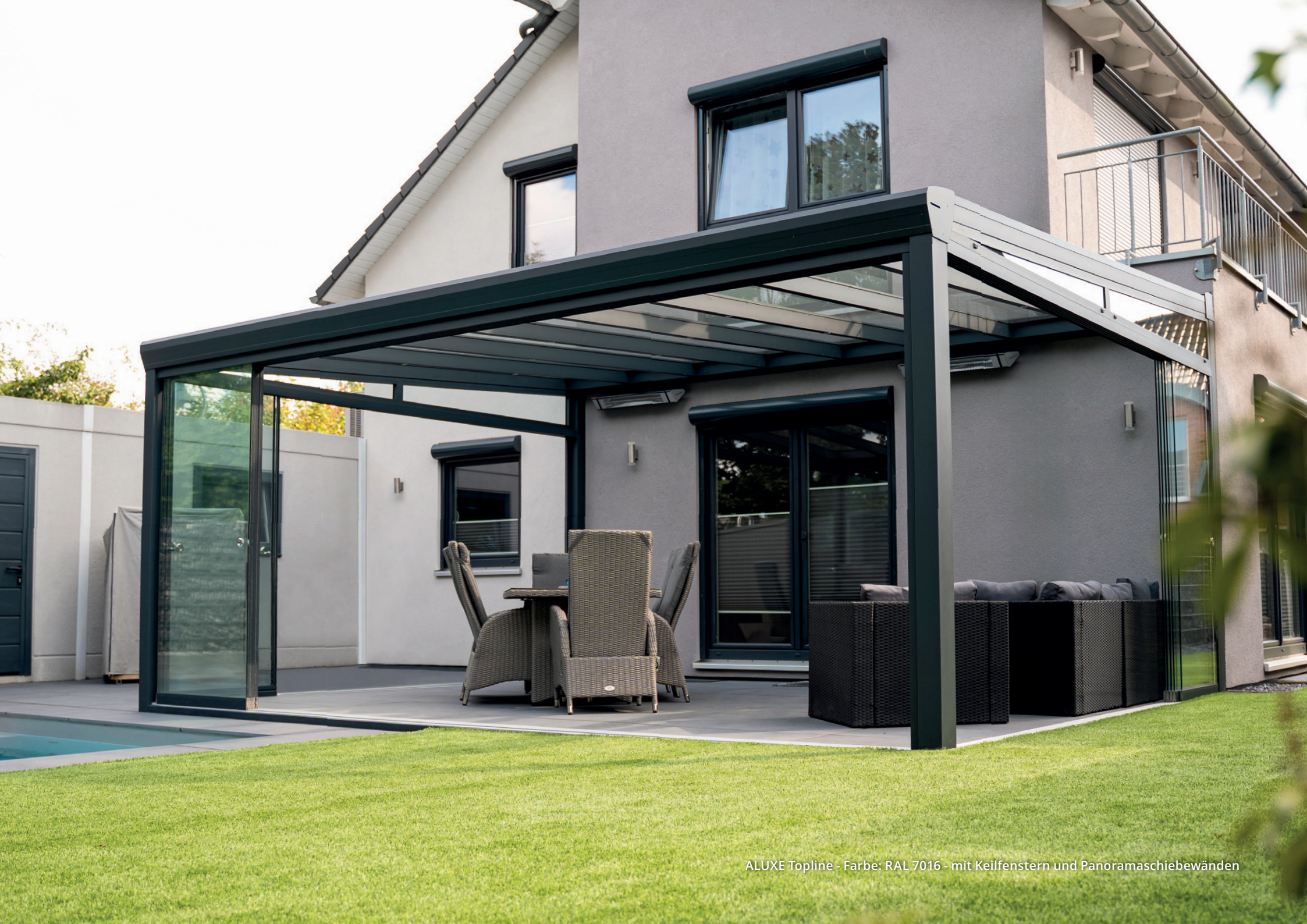
ALUXE Topline - Farbe: RAL 7016 - mit Keilfenstern und Panoramasciebewänden