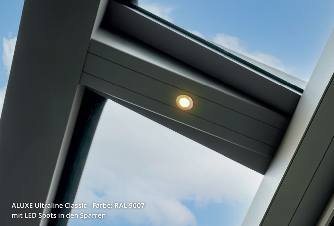
ALUXE Ultraline Classic - Farbe: RAL 9007 mit LED Spots in den Sparren