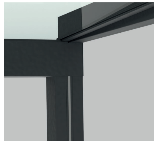
LED-STRIPES IN ULTRALINE PFOSTEN (INNEN UND AUSSEN MÖGLICH)