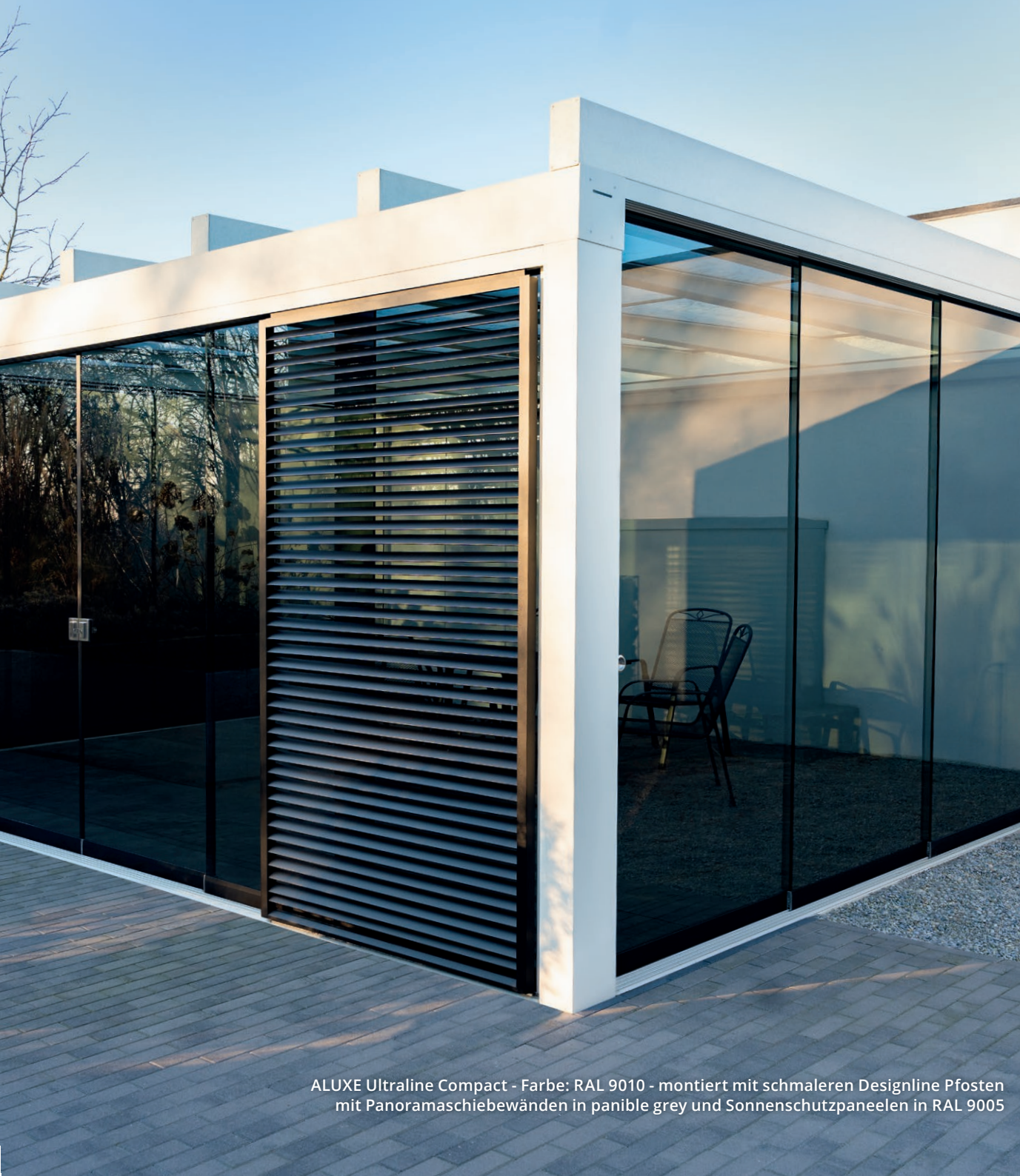
ALUXE Ultraline Compact - Farbe: RAL 9010 - montiert mit schmalen Designline Pfosten mit Panoramastiebewänden in panible grey und Sonnenschutzpaneelen in RAL 9005