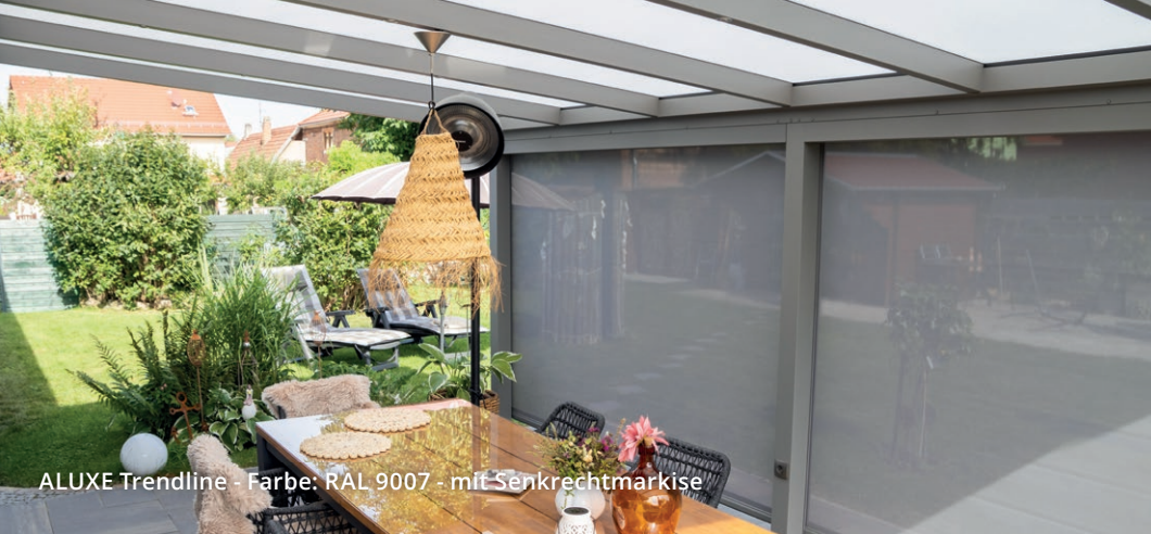
ALUXE Trendline - Farbe: RAL 9007 - mit Senkrechtmarkise