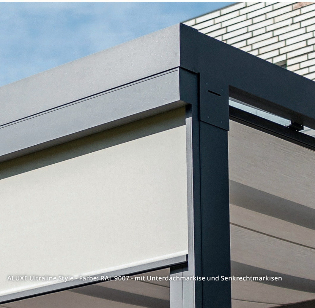
ALUXE Ultraline Style - Farbe: RAL 9007 - mit Unterdachmarkise und Senkrechtmarkisen