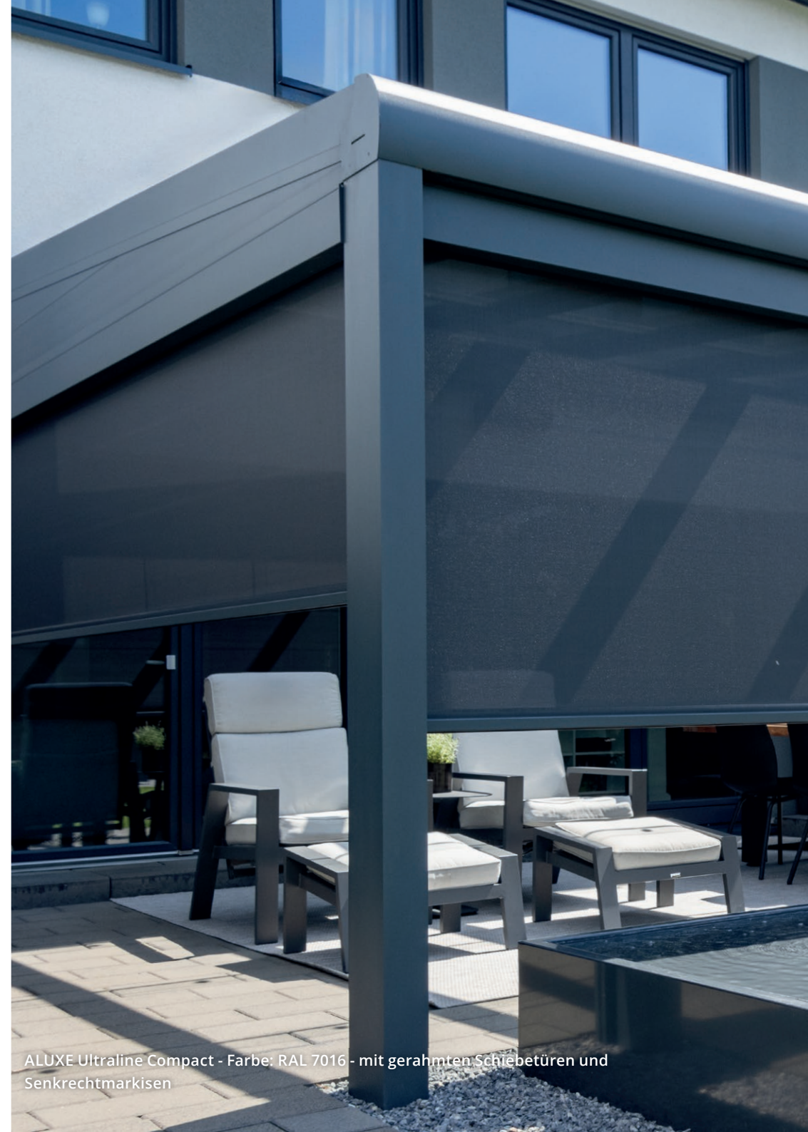
ALUXE Ultraline Compact - Farbe: RAL 7016 - mit gerahmten Schiebetüren und Senkrechtmarkisen